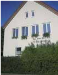
Alte Schule Tiefenbach